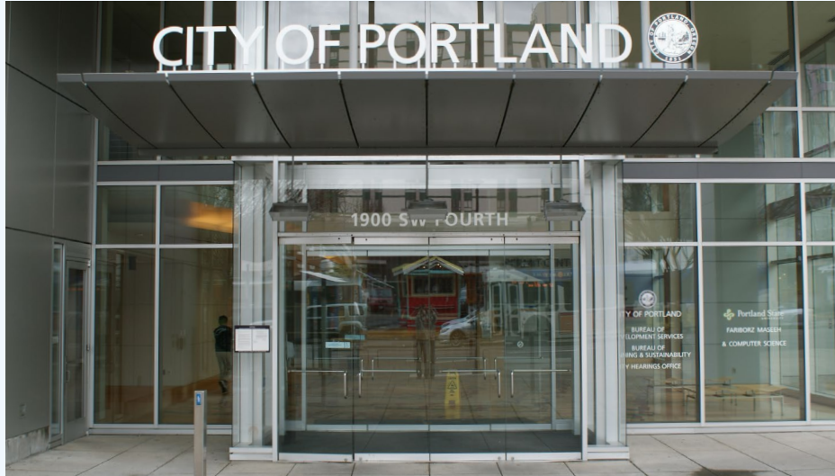
Estamos ubicados en: 1900 SW 4th Avenue, Portland, OR 97201

Las Noches de Permisos Residenciales para Viviendas Residenciales Unifamiliares o Dúplex están dedicados a los propietarios e inquilinos y es sólo para permisos residenciales. Residencial significa proyectos que están sujetos al código de vivienda unifamiliar o dúplex.