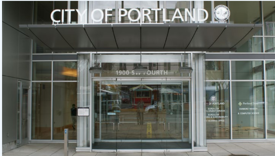
Estamos ubicados en: 1900 SW 4th Avenue, Portland, OR 97201

Las Noches de Permisos Residenciales para Viviendas Residenciales Unifamiliares o Dúplex están dedicados a los propietarios e inquilinos y es sólo para permisos residenciales. Residencial significa proyectos que están sujetos al código de vivienda unifamiliar o dúplex.