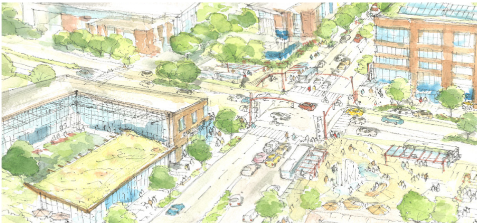
Credito foto: Creado por Travis Dang con arquitectos SERA para el Plan Jade de visión de 2014 Las áreas sombreadas