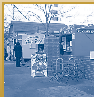
Los carritos de venta ambulante tienen permitido tener un letrero portátil. Los letreros portátiles deben estar registrados con la Ciudad.

Los carritos de venta ambulante tienen permitido tener un letrero portátil (en forma de A) por carrito. El letrero debe cumplir con el Artículo 32.30.030, Regulaciones de Letreros Portátiles (Portable Sign Regulations). Para más información sobre el registro de un letrero portátil, sírvase llamar al 503-823-2369.