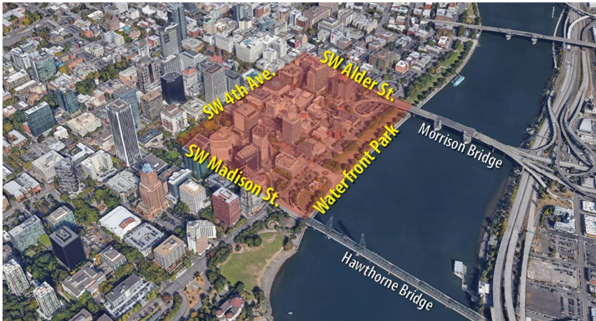
Map by Portland Police Bureau.

Check trimet.org/alerts before heading out on transit, or sign up for TriMet service alerts by email or text message at trimet.org/email . If Police determine an area has become unsafe, TriMet will adjust their service for the safety of riders and employees.